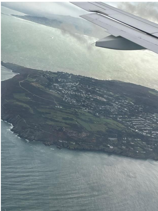
Howth, Dublin; Luftaufnahme der Küstenregion

Duschen nur zwischen 8:00 und 23:00, Abendessen jeden Tag um 19:00. Dies stellte sich nach genauerer Betrachtung der Infrastruktur des öffentlichen Nahverkehrs in Dublin als größeres Problem dar.