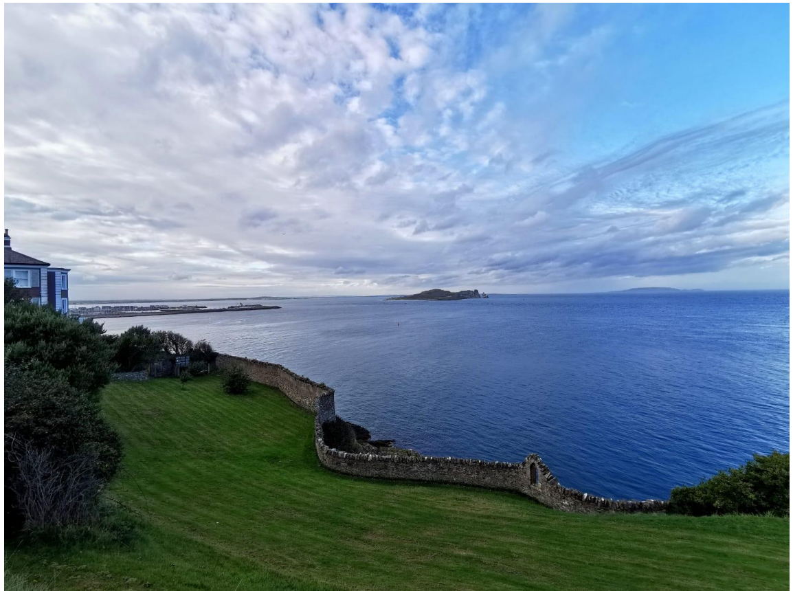
Howth, Dublin; Küstenregion im Osten der Stadt.

Nachdem das sogenannte Workplacement feststand, durften die Teilnehmer außerdem ein Essay über die Ihnen zugeteilte Firma verfassen.